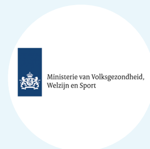
Ministerie van VWS