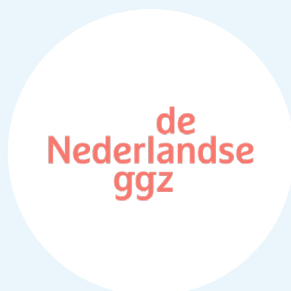
De Nederlandse ggz